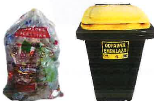
Fotografija 7: Vrečka za mešano embalažo

Za zbiranje steklene embalaže, uporabljamo plastične zabojnike, volumnov 240 l in 1100 l in sicer: