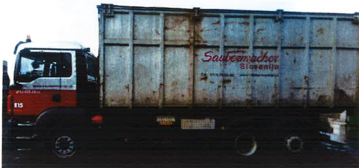
Fotografija 17: Vozilo za prevoz kotalnih prekucnikov

Za prevzemanje in prevoz kosovnih odpadkov uporabljamo kontejnerska vozila ter vozila za prevoz kotalnih prekucnikov.