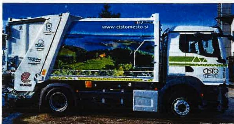
Fotografija 12 in 13: Smetarska vozila