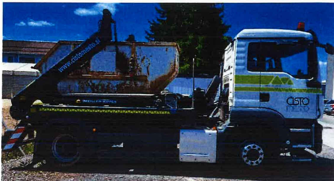
Fotografija 14: Vozilo za prevoz kontejnerjev

Za zbiranje in prevoz odpadkov iz zbirnih centrov, uporabljamo specialna komunalna vozila za odvoz kontejnerjev večjega volumna: