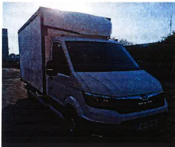
Fotografija 18: Vozila za prevoz in zbiranje nevarnih odpadkov

Za zbiranje in prevoz nevarnih frakcij uporabljamo specialna vozila, s pokritim kesonom in dovoljenjem za prevoz nevarnih snovi.