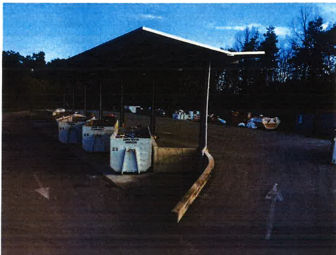
Fotografija 1: Zbirni center Kidričevo

Seznam odpadkov, ki se zbirajo v zbirnem centru: