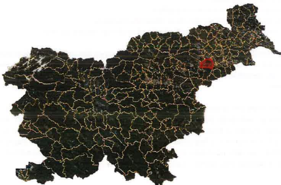
Slika 2: Lega občine Kidričevo