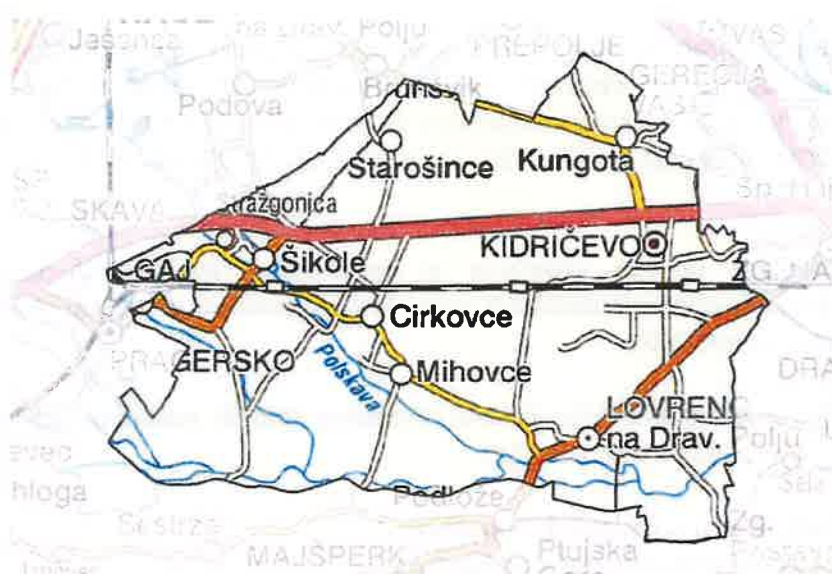
Slika 1: Zemljevid občine Kidričevo