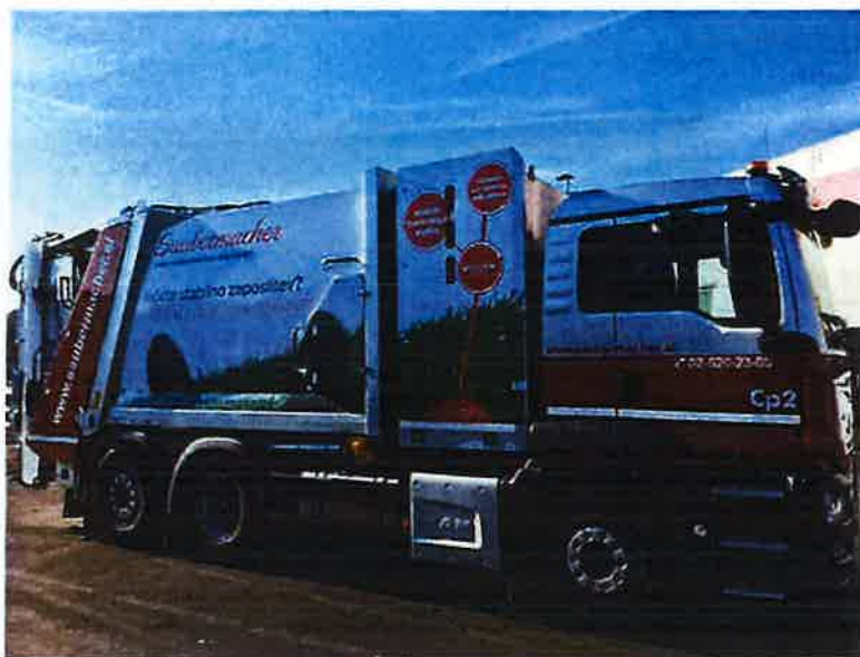
Fotografija 19: Vozilo za pranje zabojnikov za zbiranje bioloških odpadkov