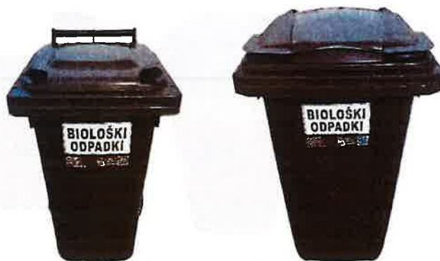
Fotografija 4: Posode za biološke odpadke