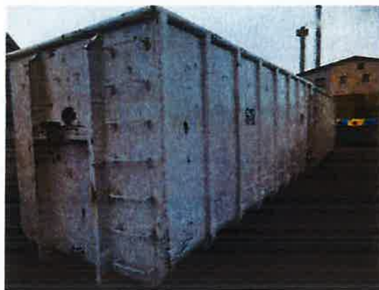
Fotografija 10 in 11: Kovinski kontejnerji