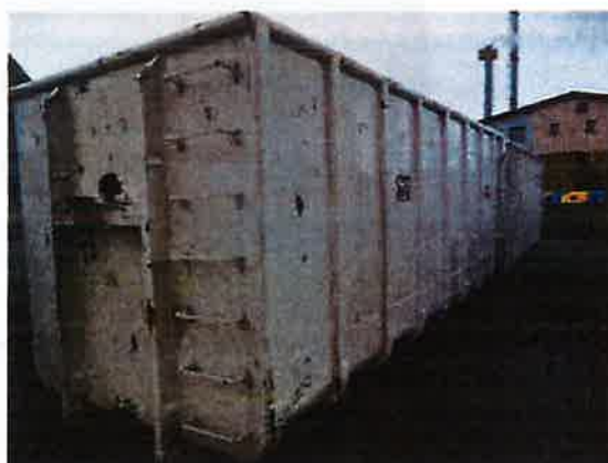
Fotografija 15 in 16: Kontejnerji različnih volumnov za zbiranje kosovnih in drugih odpadkov