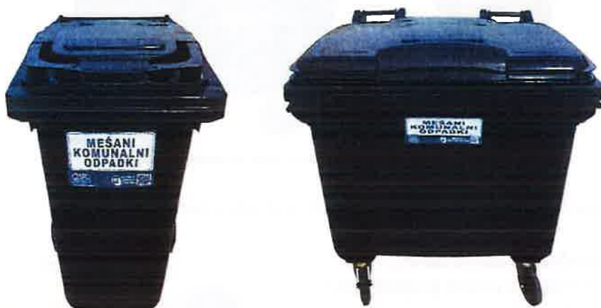
Fotografija 2 in 3: Posode za mešane komunalne odpadke