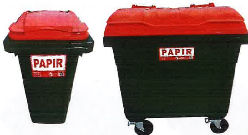
Fotografija 5 in 6: Posode za zbiranje papirja

Za zbiranje plastične embalaže ter ločenih frakcij iz plastike bomo uporabljali: