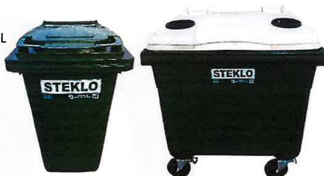
Fotografija 8 in 9: Posode za zbiranje stekla (steklene embalaže)